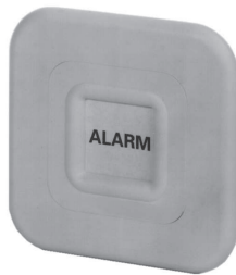
Überfallmelder uP 031591