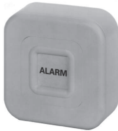
Überfallmelder aP 031590